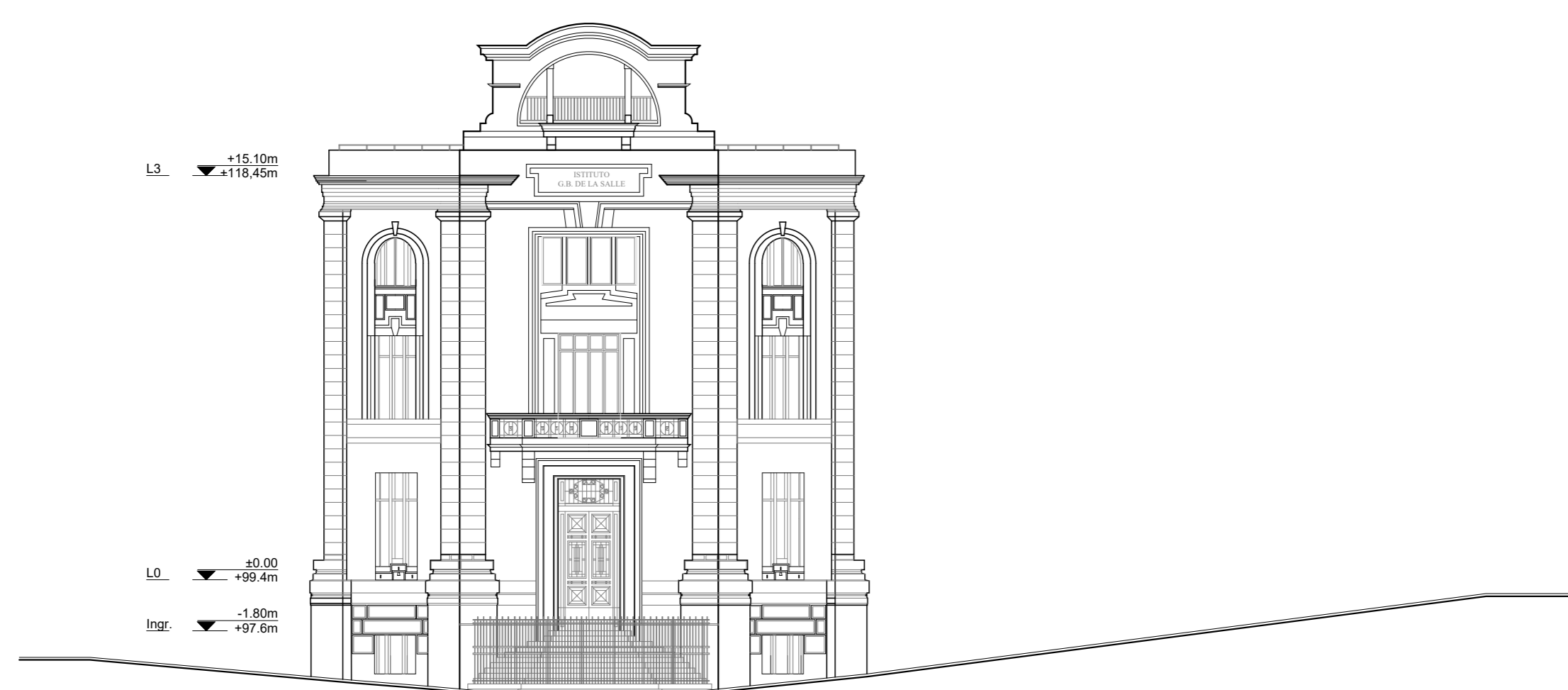
PROSPETTO INGRESSO PRINCIPALE