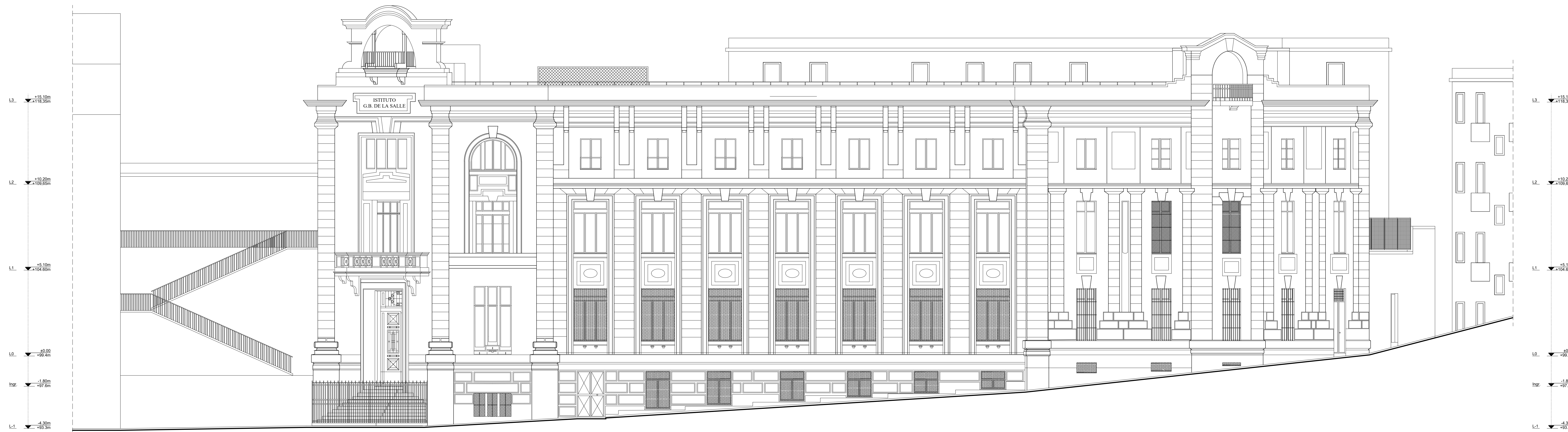
PROSPETTO NORD | EST